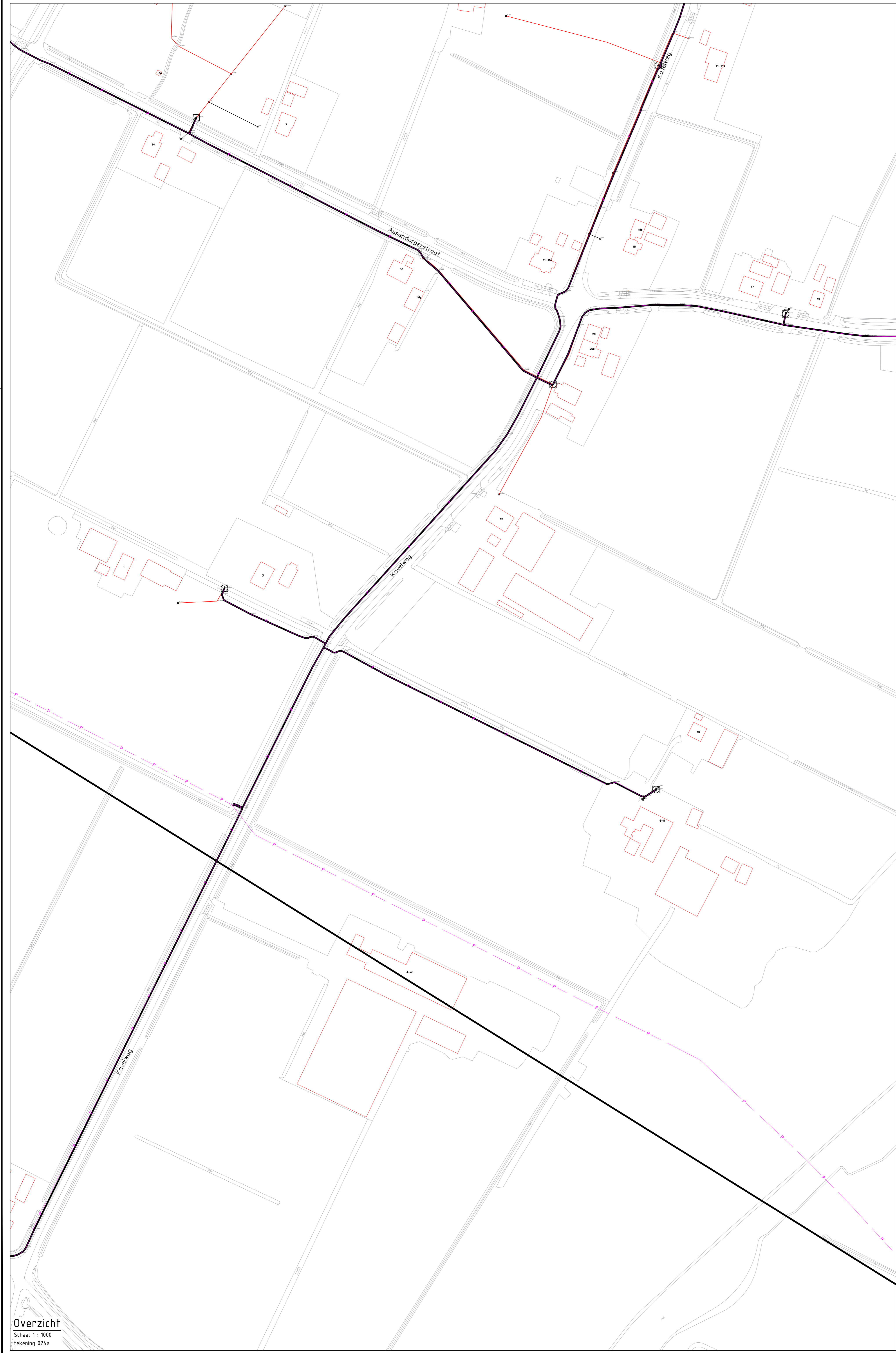
Overzicht Schaal 1: 1000 Tekening 024a