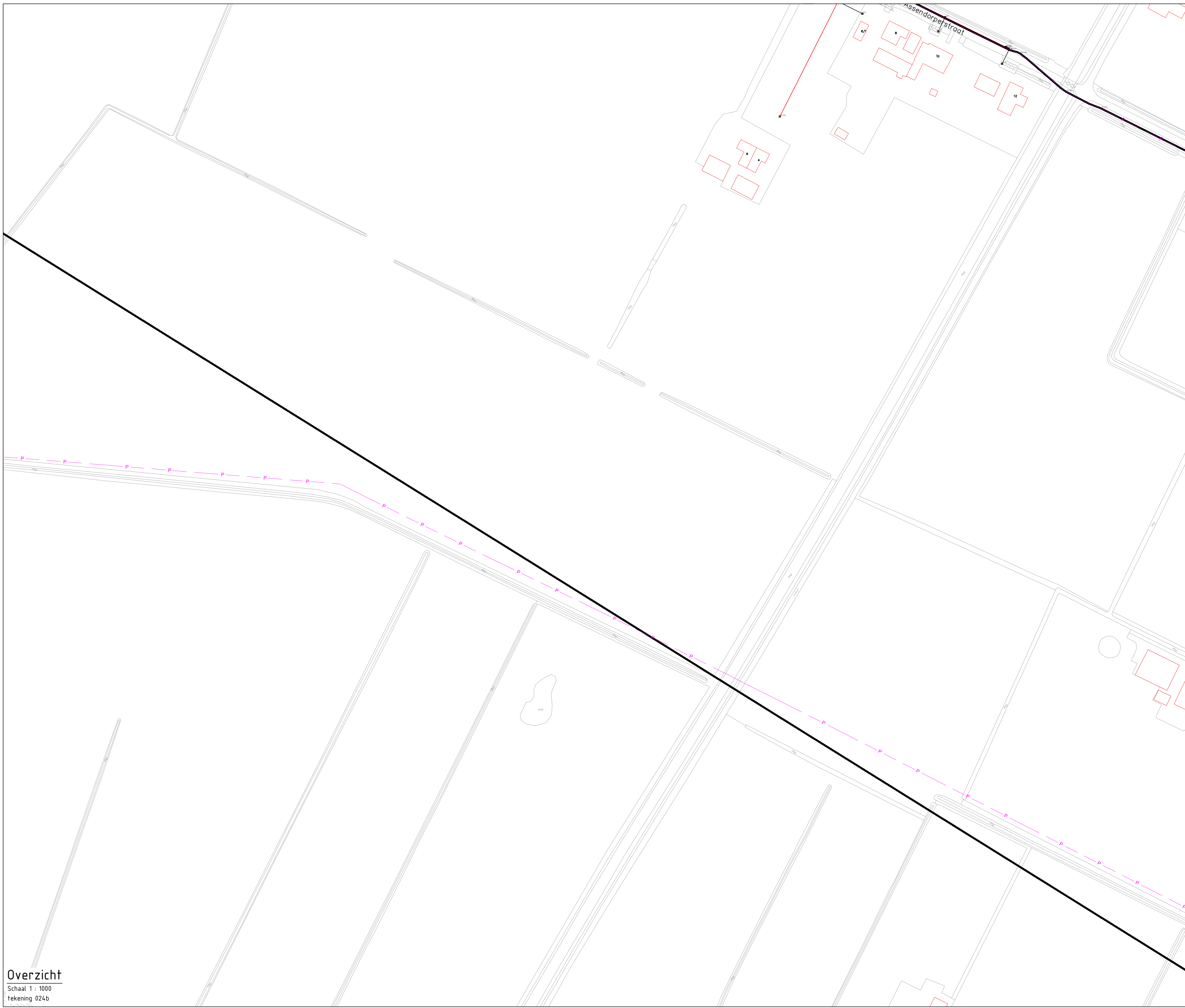
Overzicht Schaal 1: 1000 Tekening 024b